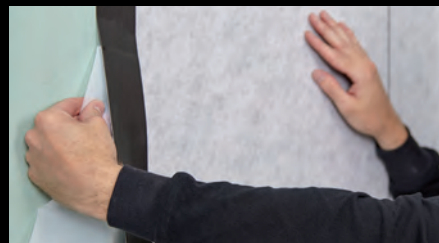
Schritt 4: Abdichten der kompletten Wandfläche mit dem selbstklebenden Abdichtungssystem.