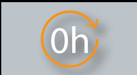
Keine Wartezeit - Sie können sofort weiterarbeiten!