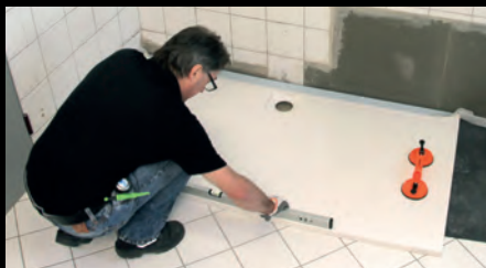
Schritt 3: Für Duschwannen stehen Wannendichtbänder und Formstücke zur Verfügung.