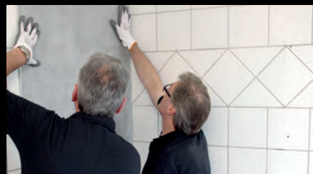
Schritt 5: Montage der HÜPPE EasyStyle Wandverkleidung mit HÜPPE 2K PU-Kleber gemäß Anleitung.