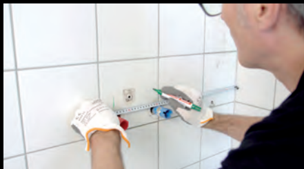
Schritt 1: Untergrund prüfen, vorbereiten und ggfs. Wandanschlüsse versetzen.