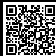
QR-Code scannen und Montagevideo anschauen.