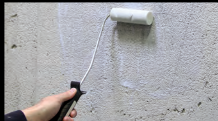
Schritt 2: Grundierung der Flächen, falls erforderlich. Trocknungszeit abhängig vom Untergrund.